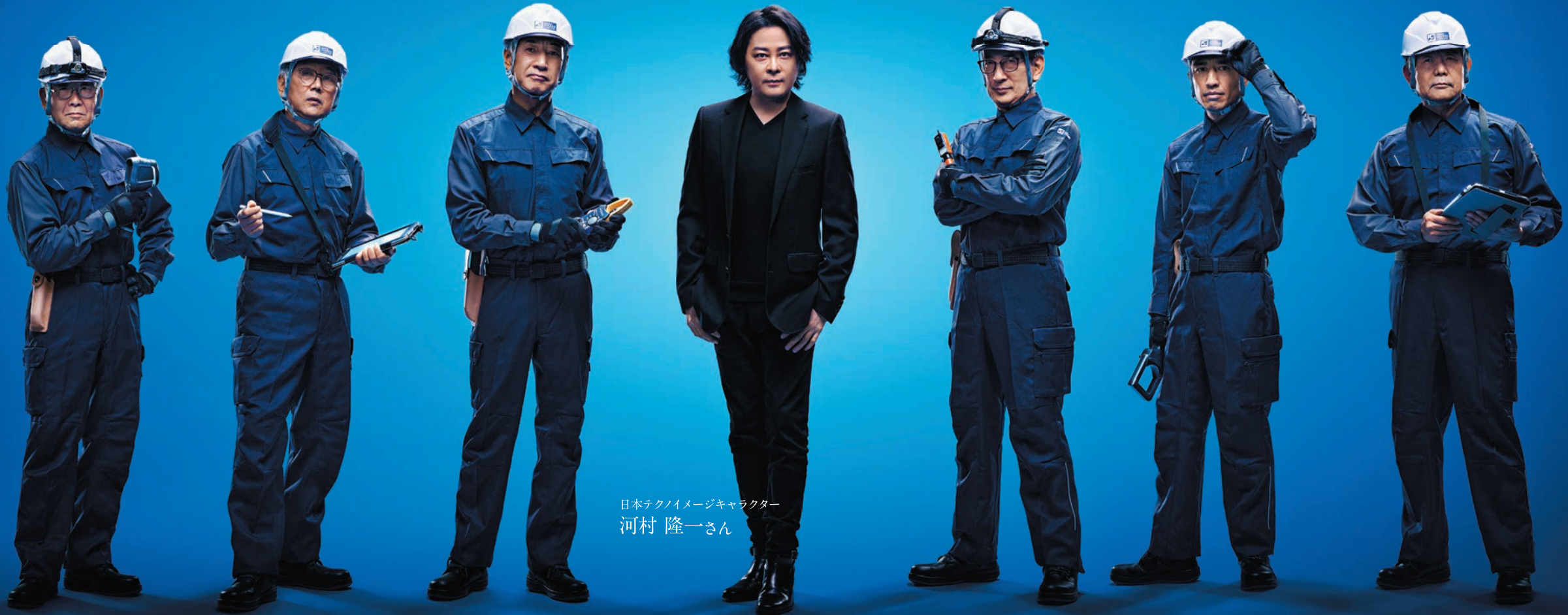
日本テクノイメージキャラクター 河村 隆一さん